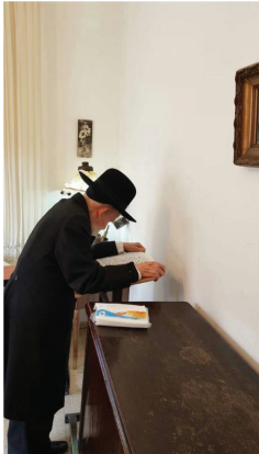
בתמונה: מרן ראש הישיבה הגר"ג אדלשטיין שליט"א מתפלל ביחידות בביתו עקב גניף הקורונה

מבואר בגמ' (פסחים דף קג:) ונפסק בשו"ע (או"ח סימן רצח סעיף ב), שמצוה מן המובחר לברך בורא מאורי האש, בהבדלה במוצאי שבת קודש על אבוקה. ונאמרו בראשונים שני טעמים לדבר. לדעת המאירי (ברכות דף נב:) והר"ן והמהר"ם חלאווה