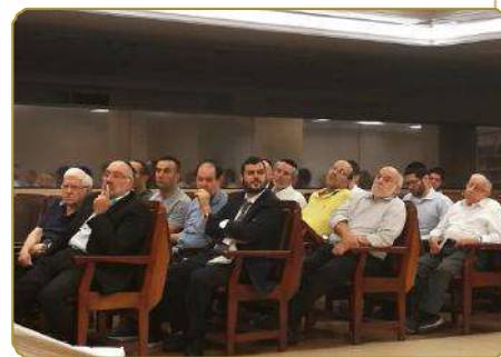
חלק ממשותפי השיעור בקהילת "מקור חיים"