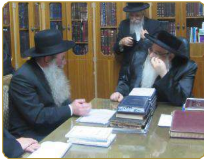
ראש המכון שליט"א בדיון הלכתי עם כ"ק מרן האדמו"ר מצאנז שליט"א

לאור זאת, פירשו צדיקים (יש דמטו הכי בשם בעל הדגמח"א ויש דמטו הכי בשם המגיד מקאז'ניץ, ובדומה לזה קצת נמצא בפתחא זעירא לספר הפלאה אות ו) בדרך רמז את מה ששינינו במשנה (אבות רפ"ב): "דע מה למעלה ממך עין רואה ואוזן שומעת וכל מעשיך בספר נכתבים". כי בשביל לדעת מה שלמעלה מאתנו ישנן שלוש דרכים. מיום היות ישראל לעם עד לתחילת ימי בית שני היה