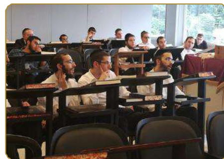
חלק מבחורי ואברכי ישיבת "באר אברהם" מאזינים לשיעור