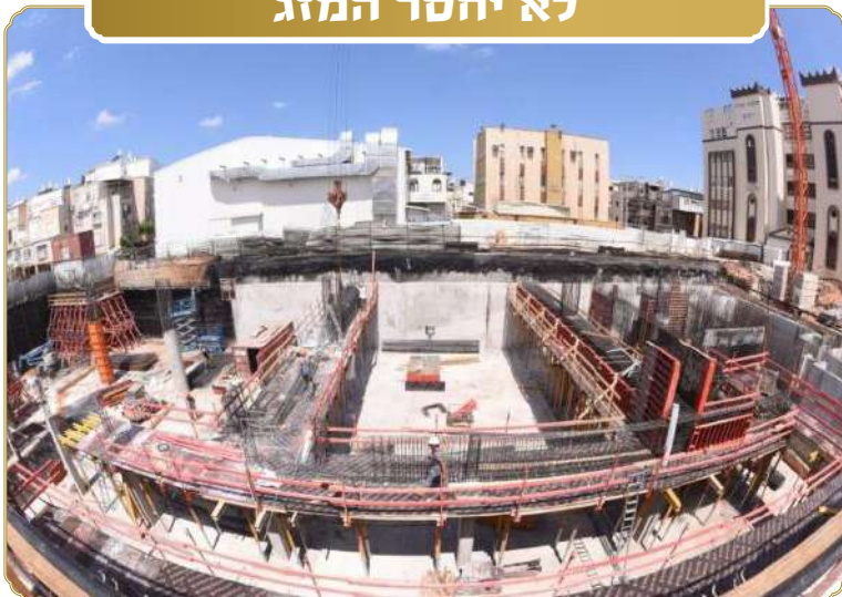
בית המדרש הגדול של מרן האדמו"ר מויז'ניץ שליט"א בבני ברק בשלבי בנייתו