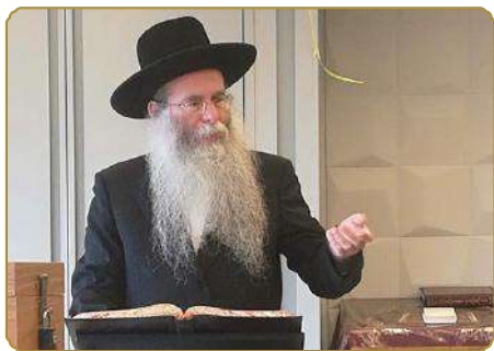
בשיעור בישיבה הגבוהה "באר אברהם"