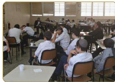
חלק מתלמידי ישיבת חב"ד ליובאוויטש מאזינים לשיעור