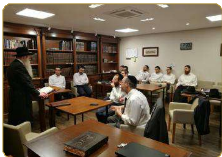
בשיעור בכולל ללימוד יו"ד בראשותו של הגר"י טוויל שליט"א