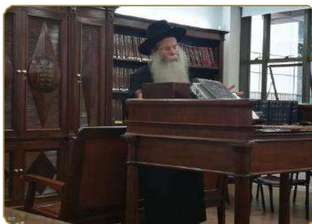
בשיעור בבית הכנסת המרכזי "בית יעקב"